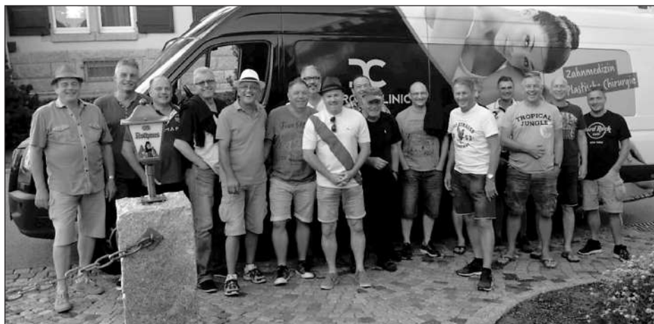
AH-Ausflug an den „Schlucksee“

Im Ü-40-Männer Europa Park-Cup spielten acht Mannschaften um den Sieg. Ganz vorne landete erstmals der FC Östringen und fährt gemeinsam mit dem Zweitplatzierten FC Heidelberg sowie dem Drittplatzierten FV Graben zur Baden-Württembergischen Meisterschaft. Für die AH des FCS war mit zwei Unentschieden und einer Niederlage leider nach der Vorrunde Schluss.