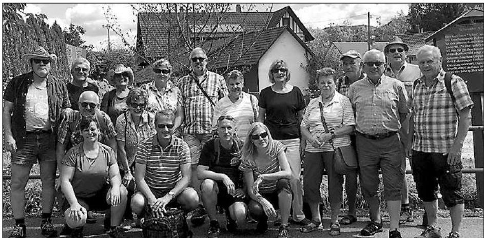
AH-Familienausflug nach Unterharmersbach