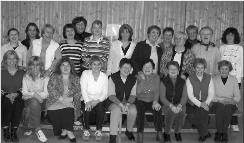
Unten: Gruppenbild mit vielen Damen. Unsere Gymnastikabteilung versteht zu feiern.