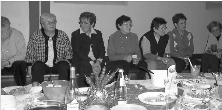
Bild unten: Die damalige Abteilung beim „Turnen“ in der Nebeniussschule