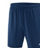
Short Profi 2.0 Damen

Schaut doch mal rein unter: fc-suedstern.teamfex.shop