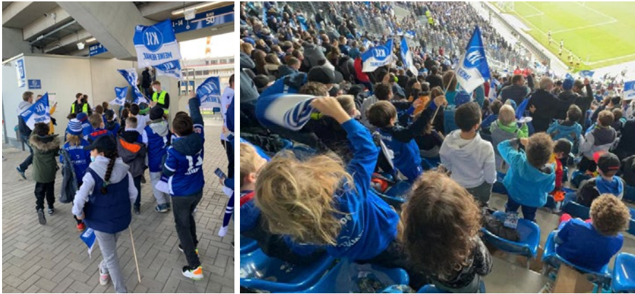
Fotos vom Mannschaftsausflug der F-Junioren ins Wildparkstadion

Bambini werden aber einige starke Spielerinnen und Spieler nachrücken. Es wird also weiterhin zur Sache gehen und der Trainingsplatz weiterhin gut gefüllt sein - eben Full House bei der F-Jugend!