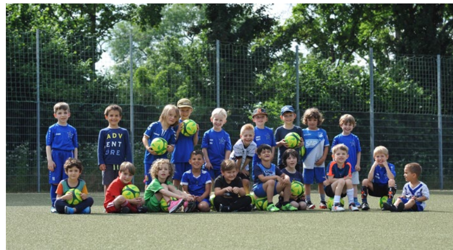
Einige unserer Spieler der Bambini-Mannschaft im Sommer 2021