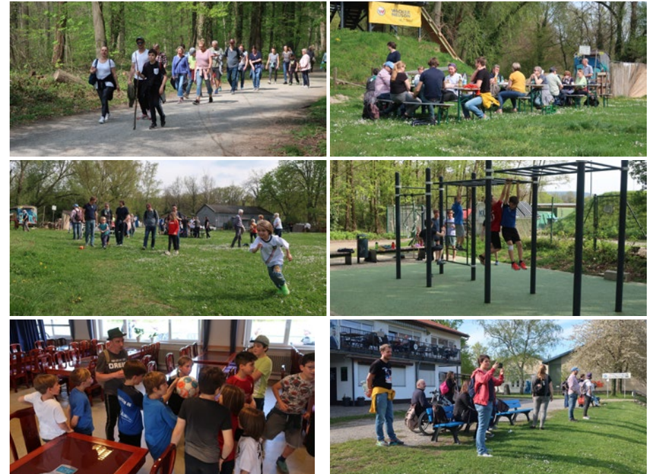
Spaß für Jung und Alt bot auch dieses Jahr wieder unser Karfreitagsausflug