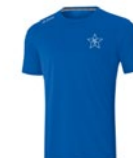
T-Shirt Run 2.0